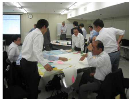
( 演習風景 )

【演習方法】・グループに分かれ、各グループで仮想の会社、事業所を想定。 ・地震発生、1時間、3時間後、1日、72日後といった時間経過に伴う変化に対して、自分を事業所の長・責任者の立場であると設定した上で、何を如何にすべきかをグループ内で討議し、発表します。