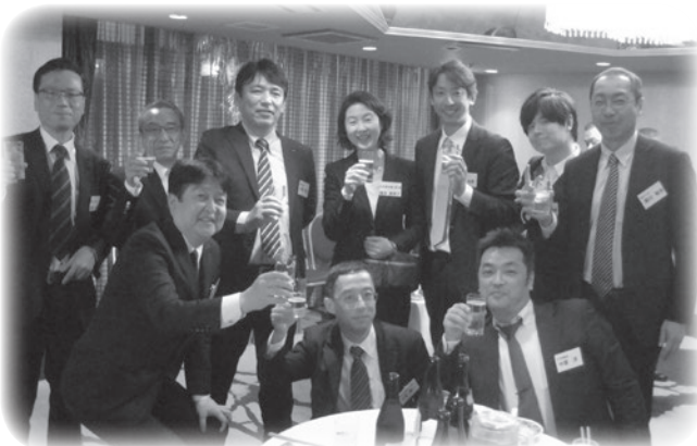
第10回最終会課題発表会後の修了懇親会

【お申込み・お問い合わせ】 一般社団法人 神奈川県経営者協会 〒231-0023 横浜市中区山下町2番地(産業貿易センタービル7階) 電話:045-671-7060 FAX:045-671-7087(URL) http://www.kana-keikyo.jp