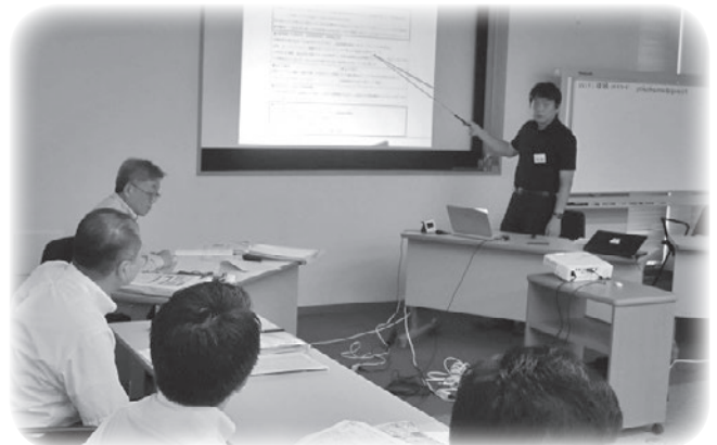
第2回講座「我が社の経営を語る」塾生による発表光景